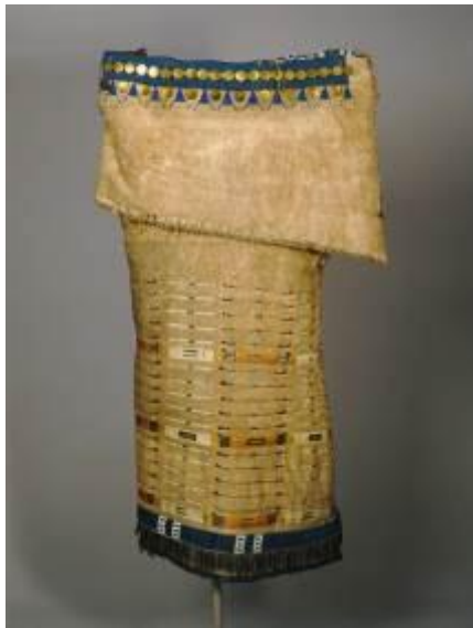
Robe de femme pliée sur le côté, vers 1800-1825, Peau tannée, piquants de porc-épic et plumes d'oiseau, boutons de cuivre, coquillages (cauris), perles de verre, cônes métalliques, crin de cheval, fibre végétale, ruban de coton tressé, étoffe de laine, 125,1 x 74,9 cm

Aussi, à chaque printemps nous attendions, impatiemment.