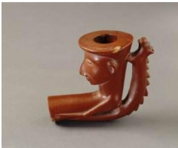
Fourreau de pipe Région ouest des Grands Lacs ou Plaines de l'Ouest vers 1800-1820