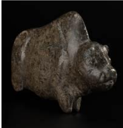
Effigie de bison, vers 1400-1700 Artiste cree des Woodlands, près d'Ardmore, Alberta (Canada) Quartzite vert, 16,5 x 22,9 cm