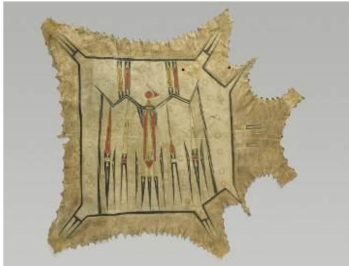
Robe peinte (détail), 71.1878.32.134