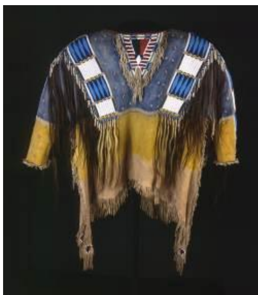
chemise d'homme, 1865

Artistes lakotas oglalas (sioux tetons), Dakota du Sud