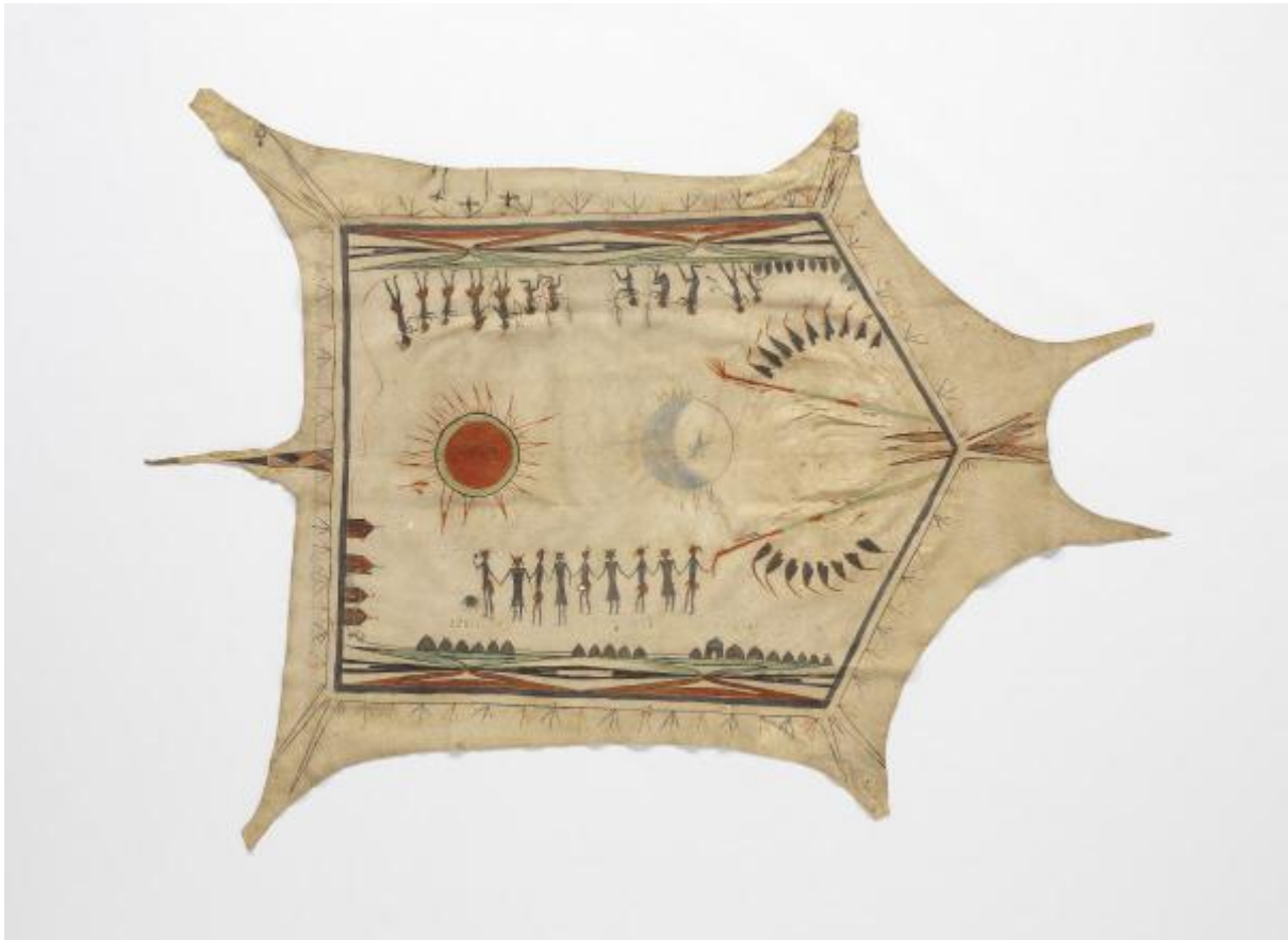
Cape, 71.1934.33.7 D vers 1740, peau de bison (?) peinte. 192 x 265 x 3 cm ; 1912 g

A travers la lecture d'extraits littéraires, l'analyse des œuvres exposées ainsi que de documents historiques et ethnographiques, ces activités pédagogiques s'adressent aux élèves du cycle 1 à la terminale et peuvent s'inscrire dans des séquences disciplinaires (arts plastiques, lettres, philosophie...) ou interdisciplinaires.