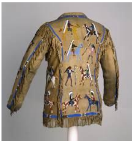
Manteau d'homme, vers 1920, Cuir (tannage amérindien), perles de verre, pigment 76,2 x 49,9 cm, Dakota du nord ou du sud, Lakota (sioux teton) Cody, Buffalo Bill Center of the West, don de Mrs Howell