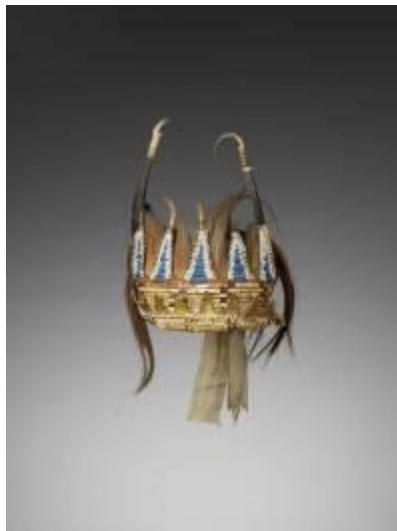
Bonnet, 71.1934.33.32 D, vers 1780 Cornes de bison fendues, babiche, poils de cerf et de cheval teints, piquants de porc-épic, perles de verre, bâtons de bois, cônes de tôle, ruban de soie, pigments rouges et verts, 30,5 x 26 x 42 cm, 365 g Grands Lacs (région des), Amérique, Sauk (population)