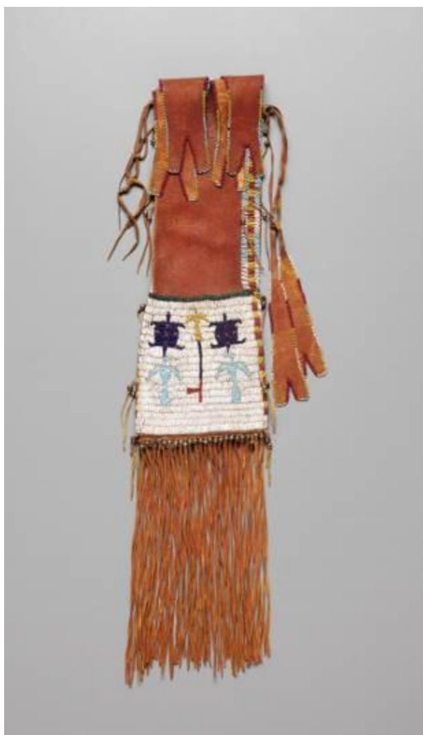
Sac à tabac, vers 1890, artiste arapaho du sud, Oklahoma, peau tannée, perles de verre et de métal, pigment, 90,8 x 16,5 cm Kansas City (Missouri) Aquis grâce au Donald D. Jones Fund for American Indian Art