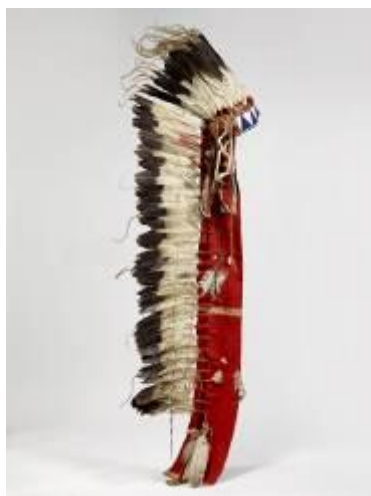
L'affiche de l'exposition montre une coiffe en plumes d'aigle et feutre rouge Sioux Dakota, datant du XIX e siècle et originaire des États-Unis d'Amérique. Inv. 71.1885.78.498

Il s'agit également de révéler, avec cet ensemble exceptionnel, le continuum de l'expression artistique des Plaines avec ses formes qui émergent, se poursuivent, évoluent, disparaissent puis renaissent sur fond de transformations culturelles incessantes, jusqu'aux créations contemporaines qui réinvestissent aujourd'hui l'iconographie des Indiens des Plaines.