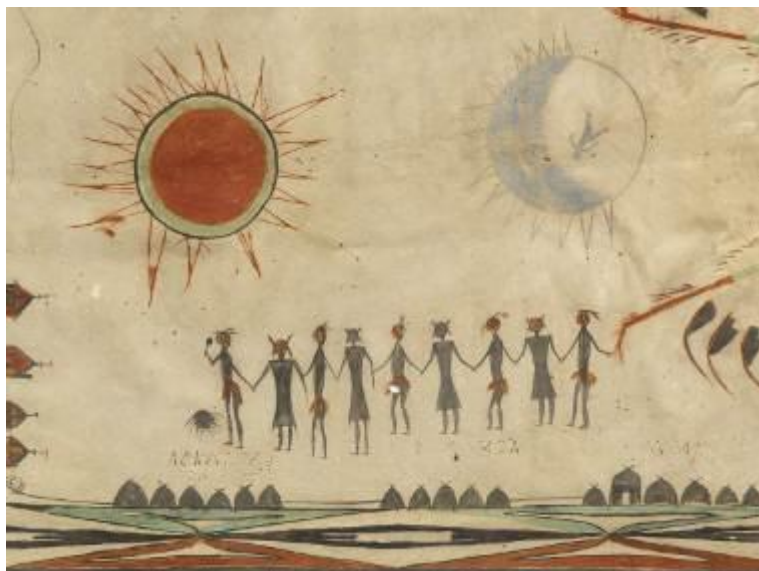
Cape (détail), 71.1934.33.7 D vers 1740, peau de bison (?) peinte. 192 x 265 x 3 cm ; 1912 g

A travers les métamorphoses successives du jeune garçon dans le 1 er conte et le voyage des Lakota dans le 2 nd , ces contes permettent aux enfants de découvrir le mode de vie (nomadisme, contrainte des saisons, alimentation et chasse), les vertus importantes (courage, habileté au tir, force, obéissance aux lois du clan, respect de la nature et de son équilibre) et les relations aux animaux et aux plantes des Indiens Pawnee et Lakota, y compris dans leur dimension spirituelle.