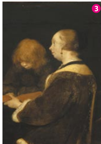
La Leçon de lecture