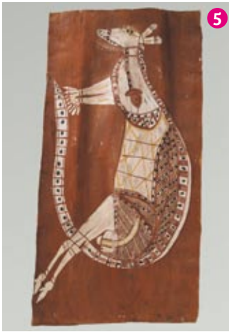
Kangourou femelle