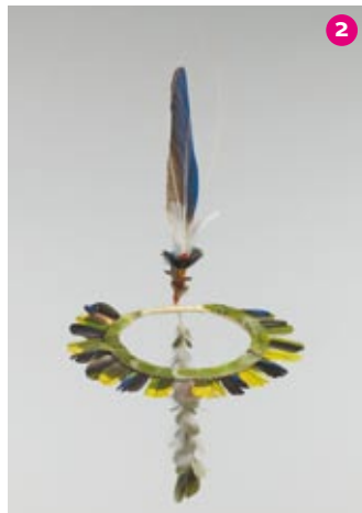
Couronne de plumes