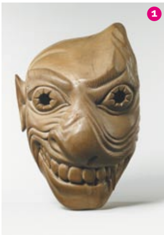
Masque de chamane Mà'Betisek © photo Thierry Ollivier, Michel Urtado. Collection particulière