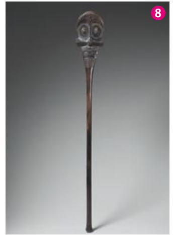
Massue U'u