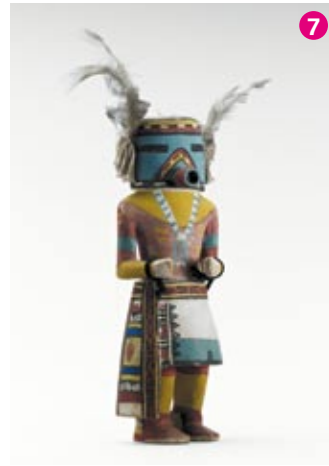
Poupée Katchina