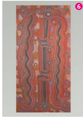
Rêve des lances witi