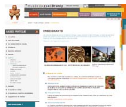
Site web www.quaibrantly.fr , rubrique Enseignants © musée du quai Branly