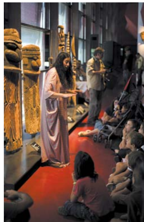
Visite contée Océanie