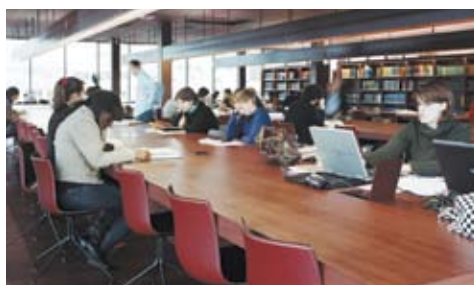
La médiathèque d'étude et de recherche

La recherche sur les catalogues en ligne ( www.quaibrantly.fr , rubrique Documentation scientifique) permet de préparer une consultation dans les quatre espaces de la médiathèque : la médiathèque d'étude et de recherche, le cabinet des fonds précieux, la salle de documentation et des archives et le salon de lecture Jacques Kerchache.