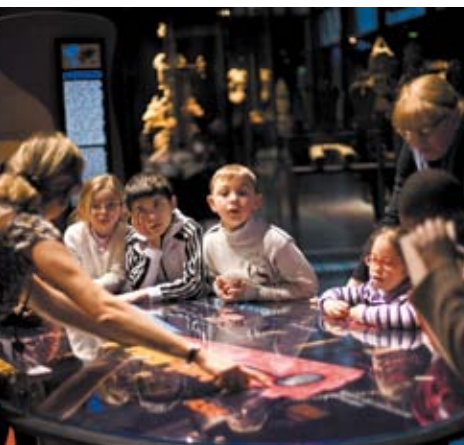
Projet Cinquième Jour Globe Trotter en faveur des personnes handicapées