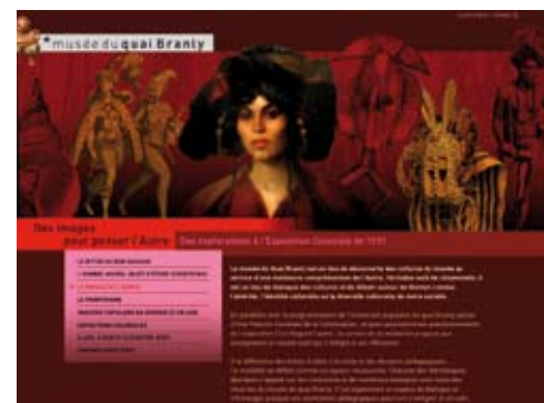
e-mallette « Des images pour penser l'Autre » © musée du quai Branly Adresse : http://modules.quaibrantly.fr/e-mallette/