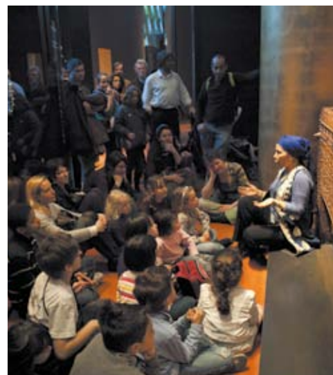
Visite contée Maghreb. La magie du désert

Contes, comptines et petits jeux : un voyage en histoires et en chansons pour un éveil des tout petits aux sonorités d'Afrique, d'Asie, d'Océanie et des Amériques.