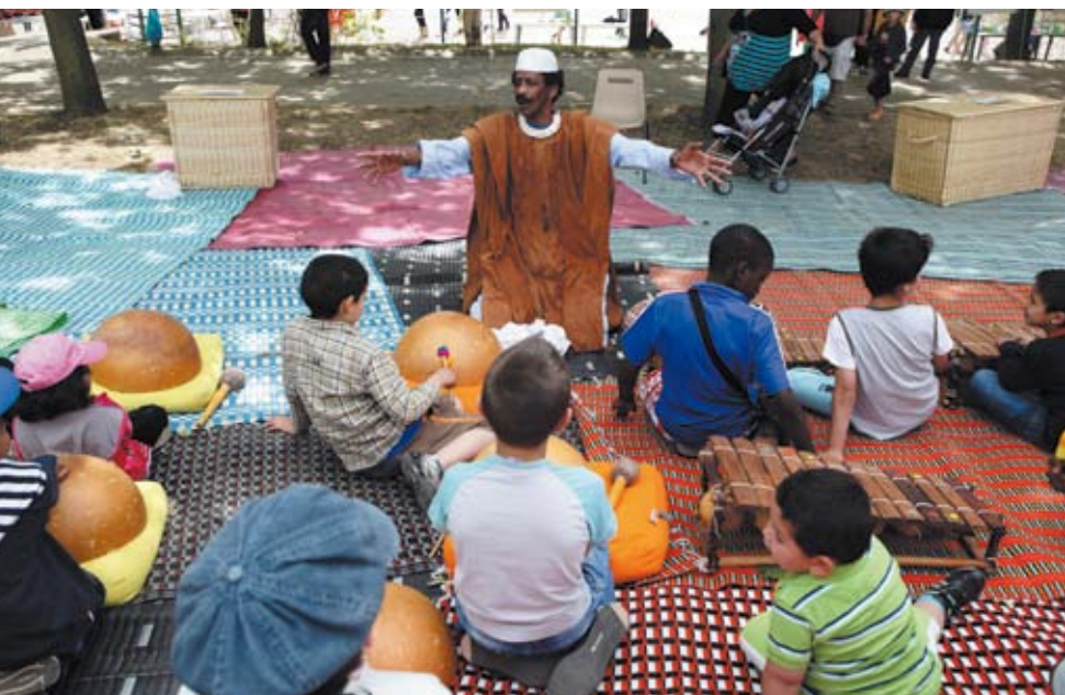
Montreuil. Hors les murs. Café Maquis. Destination musique du Mali

Retrouvez l'appel à projet dès mai 2011 sur www.quaibrantly.fr rubrique « enseignants » et sur le site de la Délégation Académique à l'éducation Artistique et Culturelle du Rectorat de Créteil.