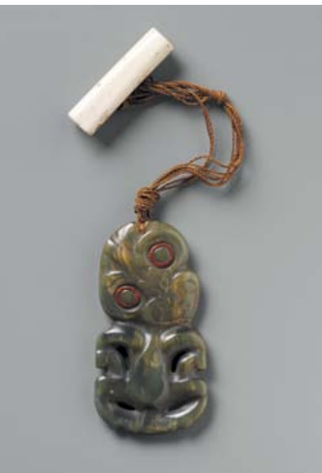
Pendentif «Hei-tiki»

Dans la plupart des cultures, des forces contraires se disputent le monde en un combat nécessaire et sans fin : les « maîtres du désordre », chargés des négociations avec les forces du chaos au cours de rites ou de fêtes, sont évoqués à travers objets et costumes traditionnels mais aussi installations et vidéos d'artistes contemporains.