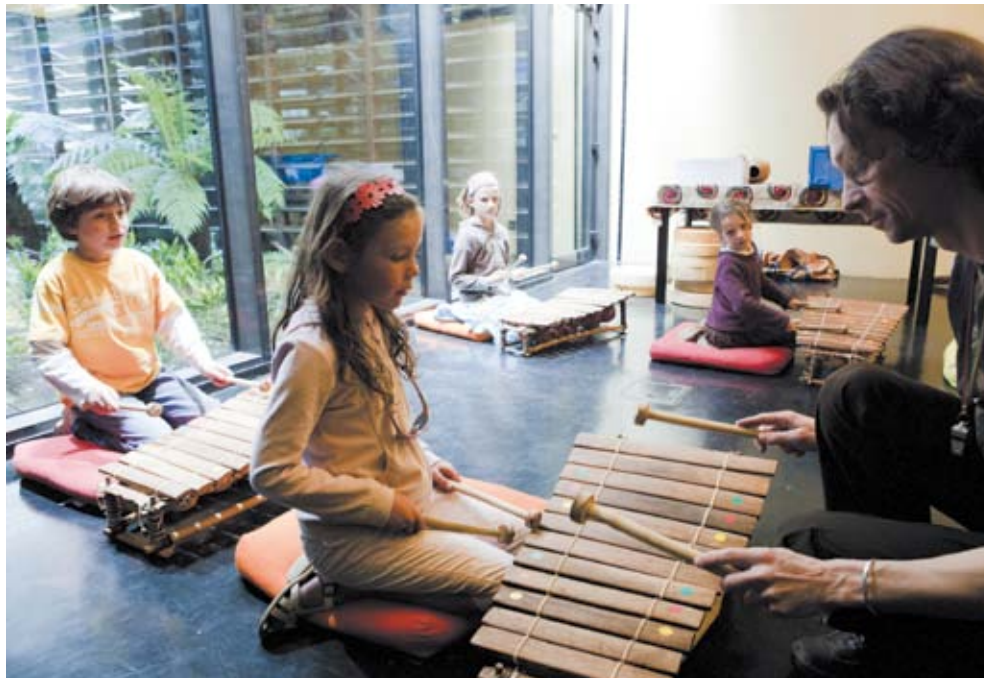
Destination : Musiques

À la rencontre des cultures par le chemin des sons ! Vos élèves écoutent, observent et jouent des instruments d'Afrique, d'Asie, d'Amérique ou d'Océanie, découvrent les musiques qui rythment la vie des hommes.